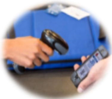
Leitura de códigos na tela do celular