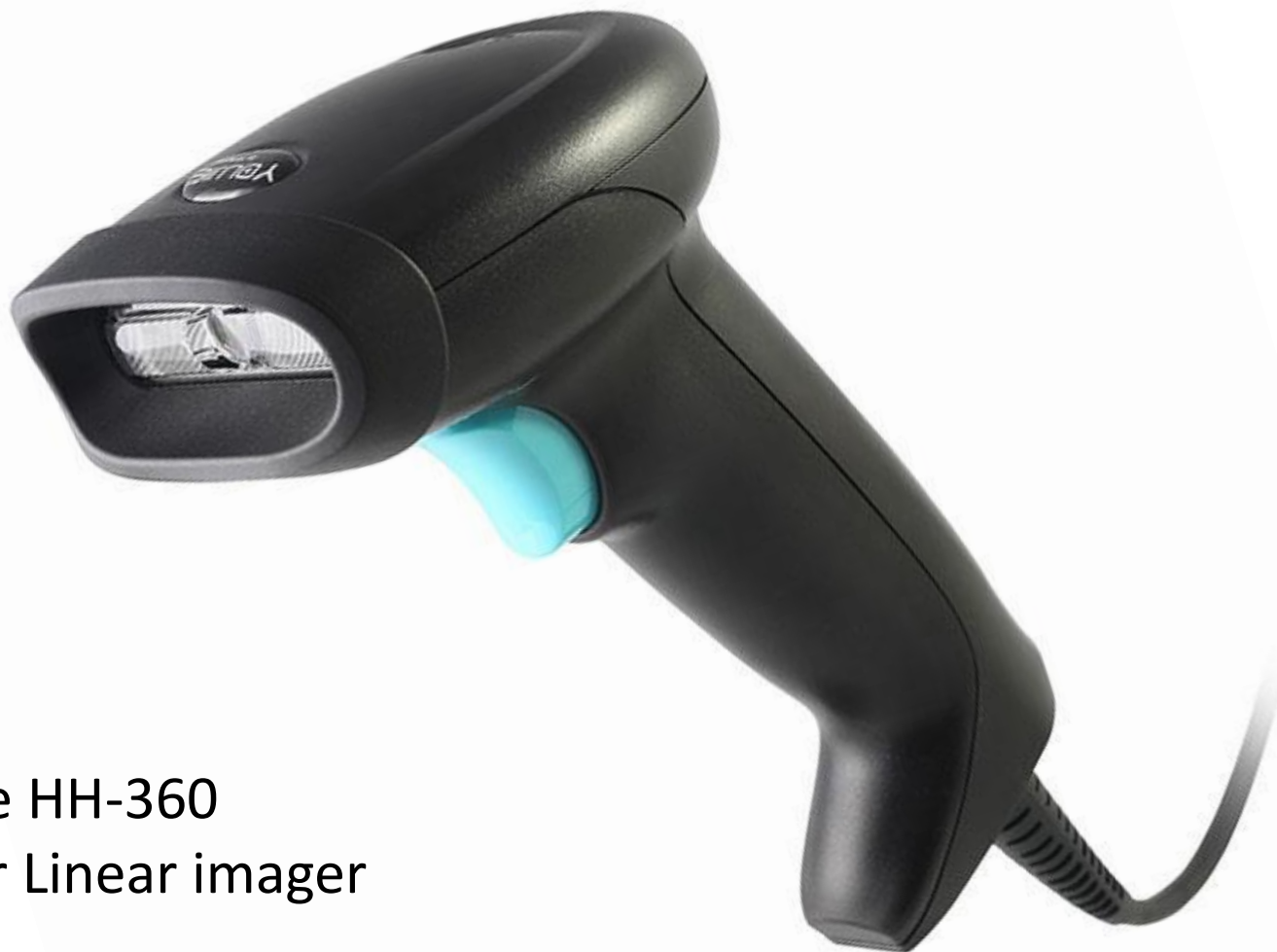
Youjie HH-360 Leitor Linear imager