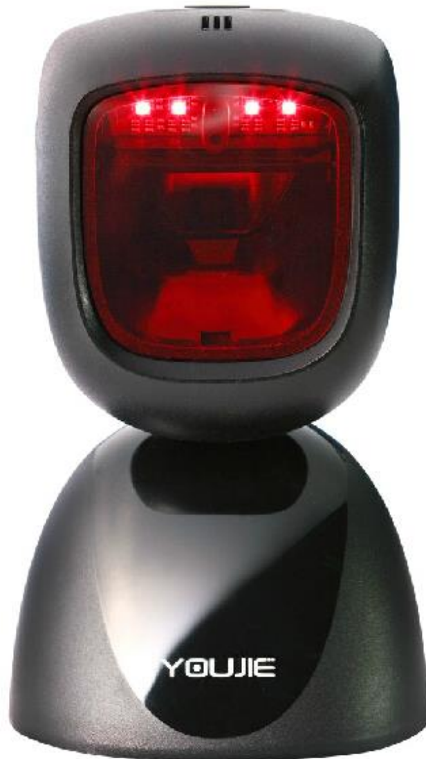
Youjie HF 600 Leitor Captura de Imagem