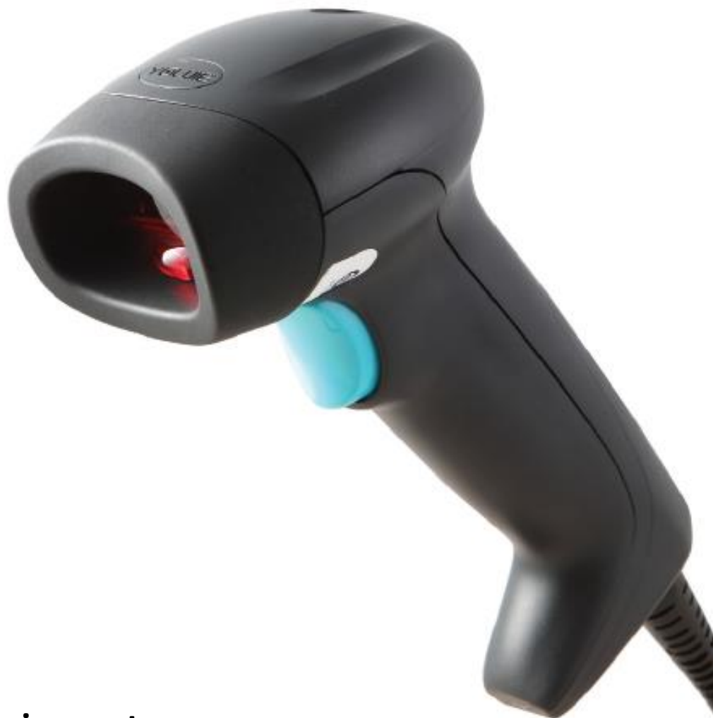
Youjie ZL2200 Leitor Laser de baixo custo