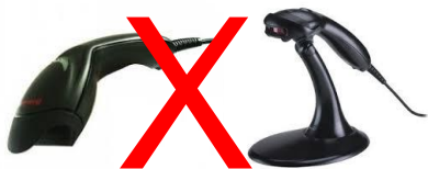
Eclipse & Voyager