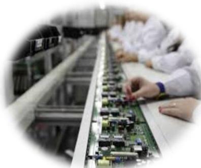
Linhas de produção