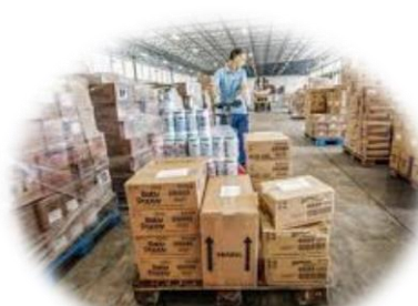
Transporte e Logística